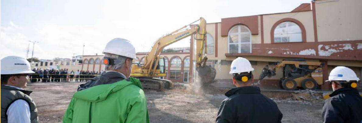
Jorge Eduardo Londoño Ulloa, director general del SENA, supervisa el inicio de la demolición del terminal de Tunja donde se construirá la nueva sede de la Entidad.

En el corazón de Tunja rugen los potentes motores de la maquinaria amarilla, anunciando el inicio de la demolición del antiguo Terminal de Transporte de pasajeros. Durante más de cinco décadas, este lugar vio pasar millones de viajeros y hoy declina su existencia para darle paso a la construcción de la obra del Distrito de Innovación para la Formación y el Empleo del Centro de Formación CEGAFE del SENA.