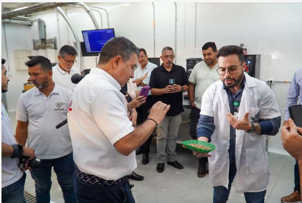
Laboratorio de Café Centro Comercio y Servicios regional Risaralda.

Con el objetivo de fortalecer la formación en las áreas de café, desde la Regional Risaralda se realizó una inversión de $860 millones en nuevos equipos tecnológicos para el proceso de producción de café.