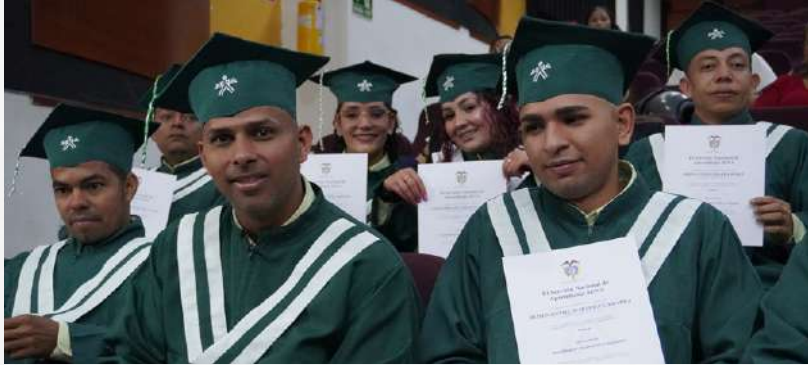
Ceremonia de graduación de 32 aprendices como Operarios en Transporte Masivo de Pasajeros en Medellín.

El compromiso con la movilidad y la formación pertinente sigue dando resultados en la región. En una emotiva ceremonia, 32 aprendices recibieron su certificación como Operarios en Transporte Masivo de Pasajeros, gracias al trabajo articulado entre el Centro de Servicios y Gestión Empresarial de la Regional Antioquia del SENA y la empresa Sistema Alimentador Oriental (SAO 6), vinculada al Sistema Integrado de Transporte del Valle de Aburrá (SITVA), bajo el modelo de Formación Dual.