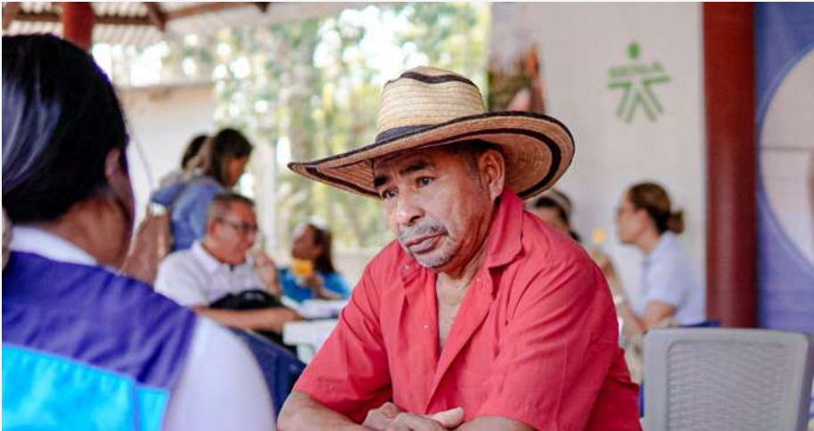
Jornada con campesinos de Sucre en la etapa dos de la estrategia CampeSENA.

Con el inicio de la fase de implementación en los municipios núcleo, CampeSENA da un paso clave para fortalecer las economías campesinas y populares en Sucre. La estrategia, ahora articulada con Full Popular, busca llevar acompañamiento directo a las comunidades mediante formación, asesoría y acceso a servicios.