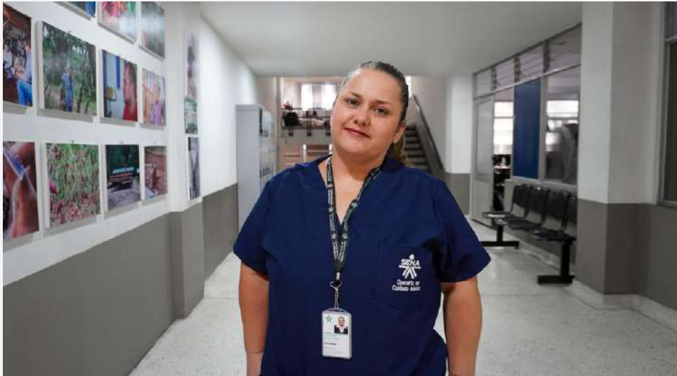
Tiene dos facetas y dos propósitos: Enorgullecer a sus hijos y servir a los demás.