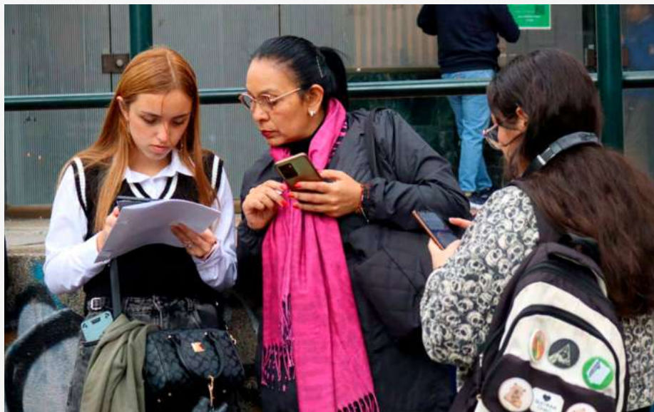
Expo Empleo Mujer 2026 un encuentro entre los sueños y las metas. Cientos de mujeres se conectan con nuevas oportunidades laborales para transformar su futuro profesional.

Las metas profesionales de miles de mujeres encontraron un camino claro en el cierre de Expo Empleo Mujer 2026. La jornada, que se consolidó como un puente directo entre el talento y la productividad, no solo dejó récord en inscripciones, sino historias de vida que comienzan a transformarse gracias a la intermediación de la Agencia Pública de Empleo (APE).