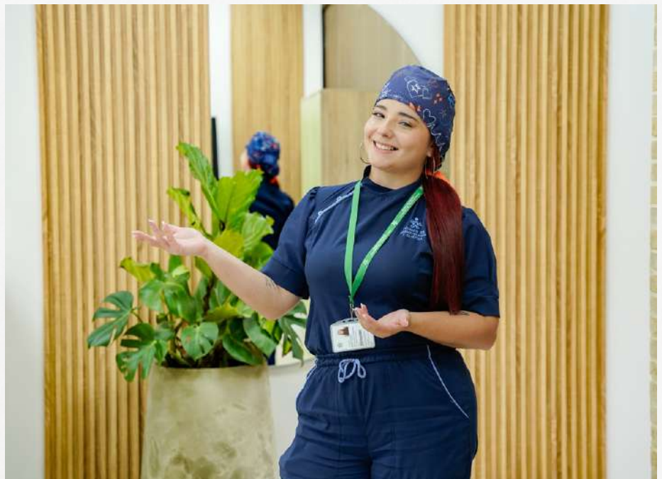
Aprendiz del SENA beneficiada con apoyo socioeconómico como parte de la herramienta dirigida por el grupo de Bienestar al Aprendiz.

Los aprendices SENA, matriculados en programas técnicos y tecnológicos, pueden acceder a diversos apoyos socioeconómicos que buscan facilitar su permanencia y éxito en la formación.