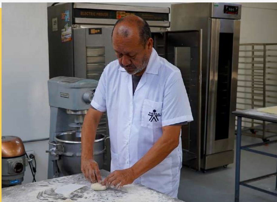
Modernización del ambiente de Panadería que permite a aprendices desarrollar su formación en la Regional Risaralda.

El SENA Regional Risaralda está comprometido con la formación, por esto ha realizado una inversión de más de 150.000.000 de pesos para la adquisición de nuevos equipos y la adecuación del ambiente de panadería, respondiendo así a las exigencias actuales de esta industria a nivel regional y nacional.